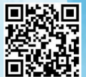
connpass website (参加申込みサイト)

詳細は、connpass website 7 でご確認ください。 ※参加者には、LOCAL学生交通費支援等の一部補助します。